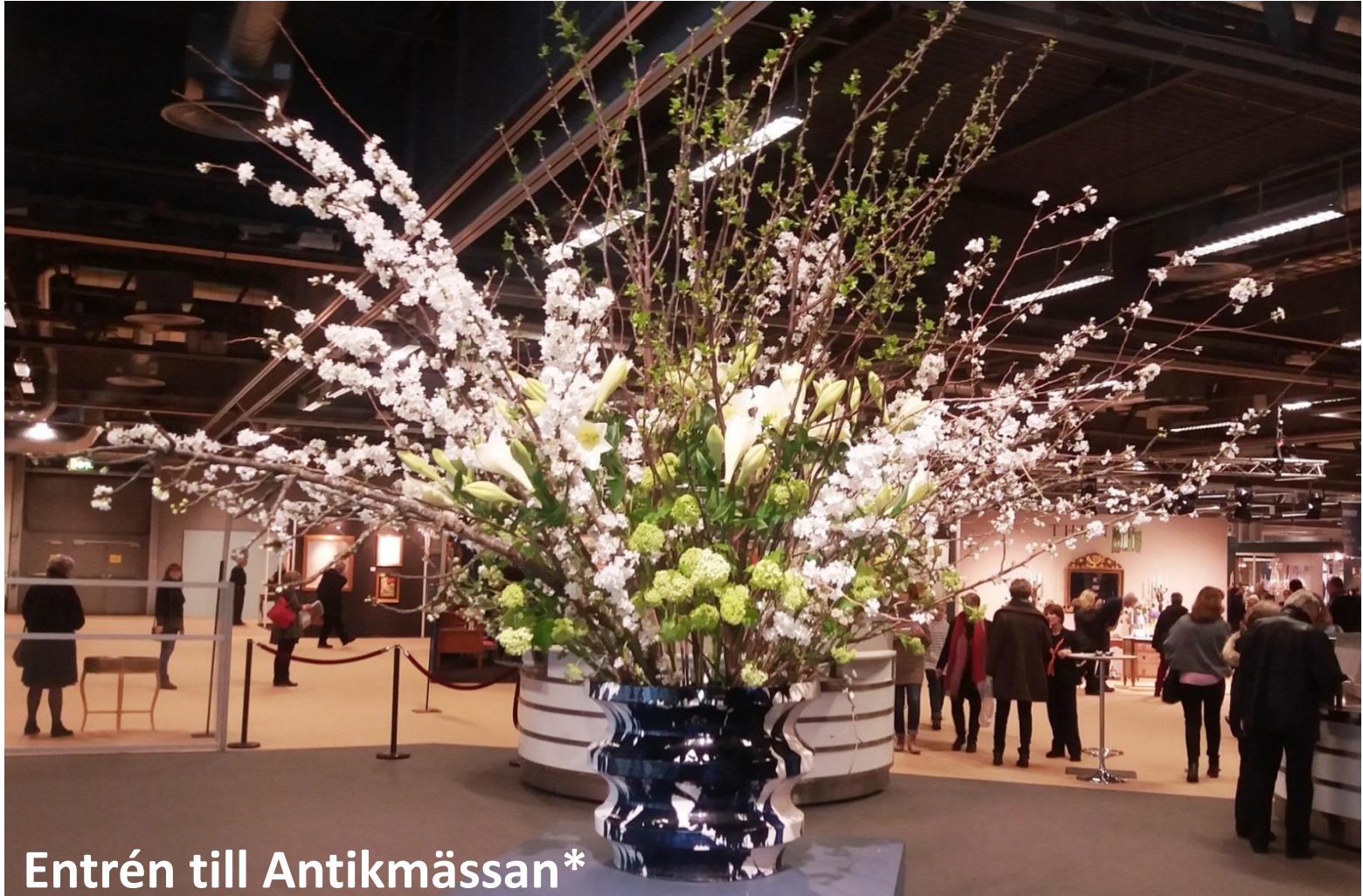
Entrén till Antikmässan*

*Praktvas från Upsala-Ekeby av Peter Celsing och Ulrik Samuelsson