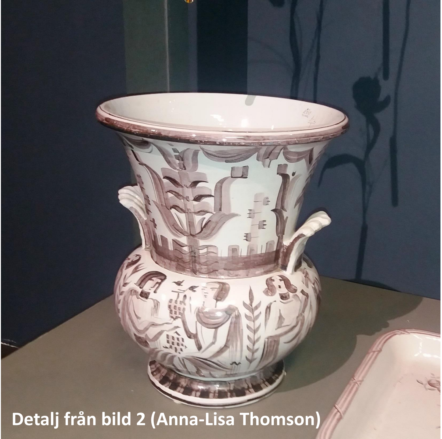
Detalj från bild 2 (Anna-Lisa Thomson)