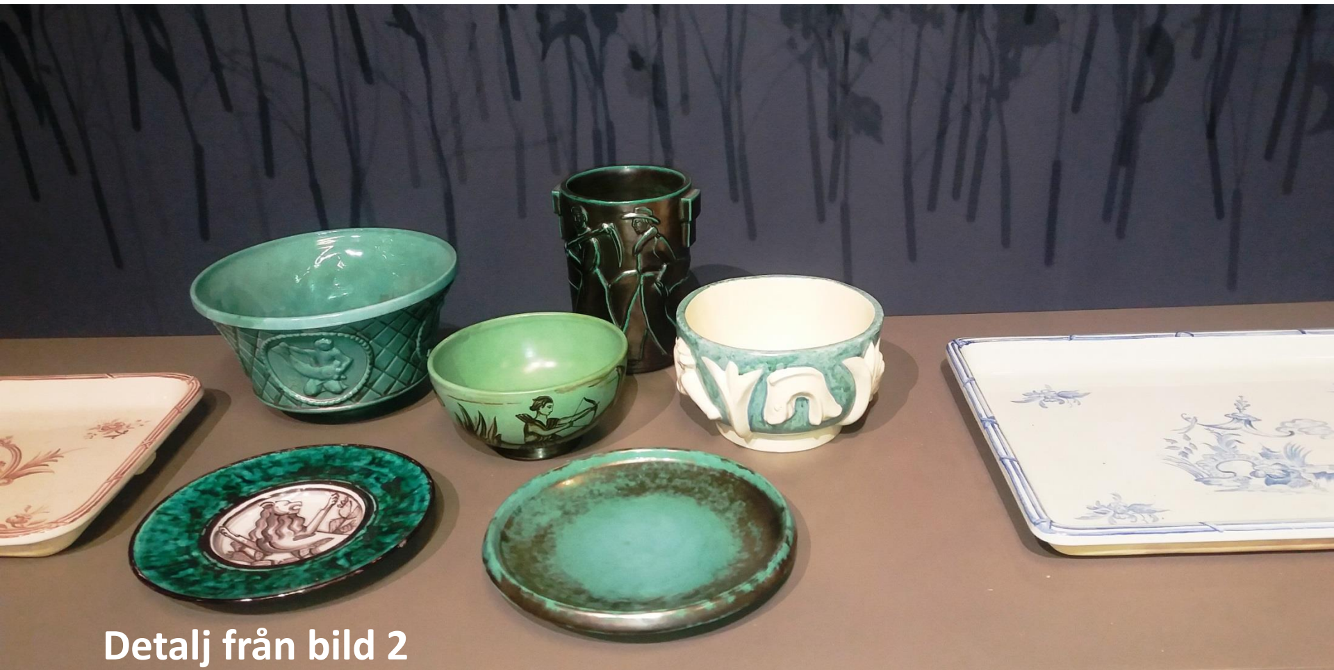
Detalj från bild 2